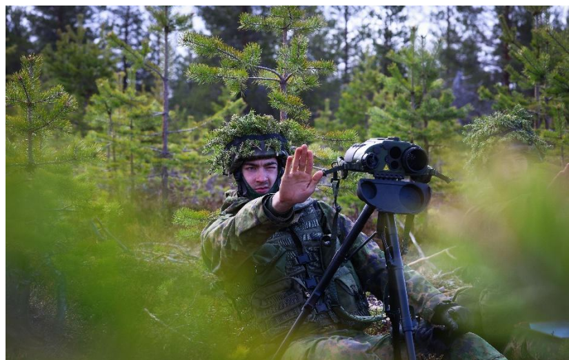
Värnpliktig finsk eldledningssoldat under Northern Strike, Rovaniemi.

På Rovajärvi skjutfält i norra Finland genomfördes övningen Northern Strike - Northern Star 2025 i slutet av maj. Övningsdelen Northern Strike var den inledande skarpskjutningen med indirekt eld. Drygt 6500 soldater och officerare från Sverige, Finland och Storbritannien deltog och fokus var fortsatt utveckling av interoperabiliteten mellan deltagande länder. Inom armén deltog svenska förband i brigadstruktur som leddes av en högre finsk stab. Rent praktisk övades gemensamma och korsnationella skjutningar. Bland annat ledde Svensk JTAC (Joint Terminal Attack Controller) med sin JFIST-grupp in eld från brittiska attackhelikoptrar. Finska eldledningsgrupper skickade måluttåg till svenska artilleripjäser för bekämpning och tvärtom.