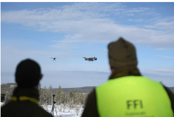
”Drönarsvärmar” under Arctic Strike på Älvdalens skjutfält.