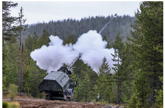
Archer skjuter under Northern Strike 25 på Rovajärvi skjutfält.