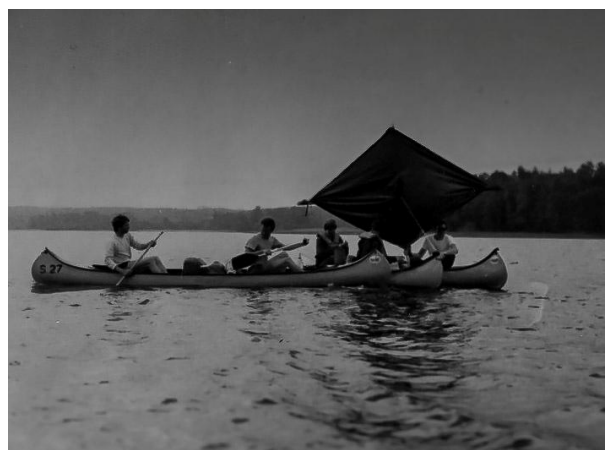
Återträff juni 1983 - Kanotsegling med knäppetält

På A1 i Linköping utbildades åren 1979/1980 Eldledare och sambandsbefälbefälselever på 1. komp, 2. pluton till blivande artillerister. Där och då skapades en sammanhållning och en förmåga att samarbeta, en för alla – alla för en. Ett antal återträffar har skett genom åren och nu, 45 år efter muck, samlades plutonen åter och denna gång för en 24-timmarsövning.