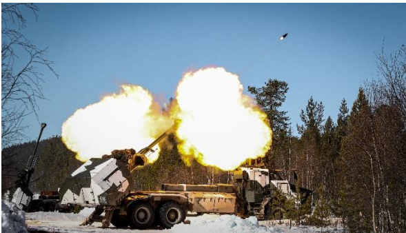
Archer skjuter under BrigU på Älvdalens skjutfält.

Både brigadunderstödsövningen, BrigU i Älvdalen och Northern Strike, Northern Star 25 i norra Finland innehöll delar där den svenska armén och funktionen indirekt eld nu återtagit viss förmåga för att strida i större enheter.