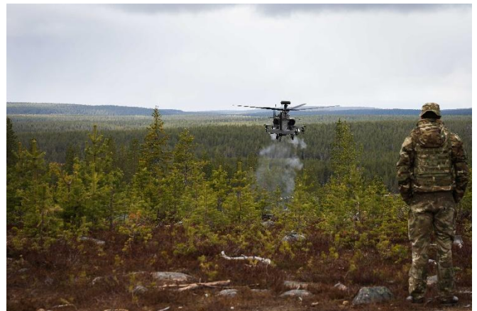
Brittiska attackhelikoptern AH-64 Apache leddes in av svenska, finska och brittiska JTACs på Rovajärvi skjutfält.