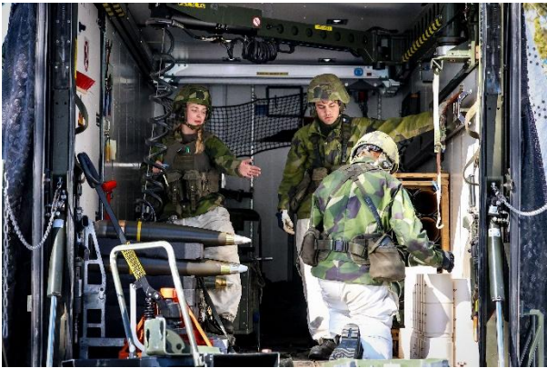
Ammunitionsuppfyllnad på pjäskompaniet på Älvdalens skjutfält.

Parallellt med olika vapensystem provades även nya kommunikations- och sambandslösningar för att säkerställa robust samband i miljöer där traditionella system har svårigheter.