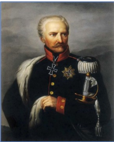
General och Fältmarskalk Blücher

Man kan säga att andra världskrigets första riktiga krigshandling i Västeuropa var eldstriden och sänkningen av kryssaren Blücher, först kan vi titta tillbaka och reda ut vem Blücher var.