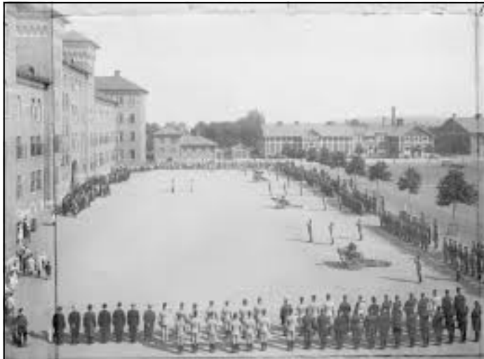
"A6 uppställt för 25-års jubileum år 1920"

Namnbytet till Smålands artilleriregemente skedde 1905. Samma år byggdes kasernen ut med de yttre flyglarna och det blev 48 logement med plats för 768 soldater. Strax efter fick man ordningsnumret A6.